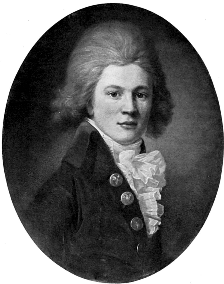
Графъ Павелъ Александровичъ Строгановъ въ юности (Voile, 1795).