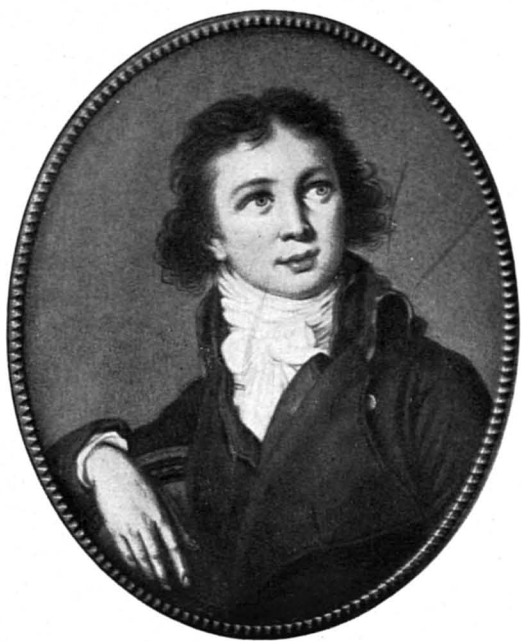
Графъ Павелъ Александровичъ Строгановъ. (Съ миниатюры Строгановской коллекціи).