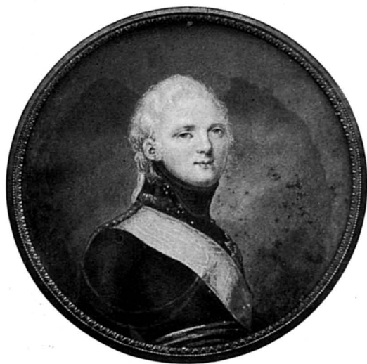
Императоръ Александръ I въ молодыхъ годахъ.

(Съ миниатюры, принадлежавшей Талейрану, нынѣ составляющей собственность великаго князя Николая Михайловича).