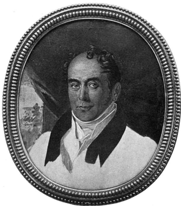
Графъ Викторъ Павловичъ Кочубей. (Съ неоконченной миниатюры Винберга, принадлежащей великому князю Николаю Михайловичу).