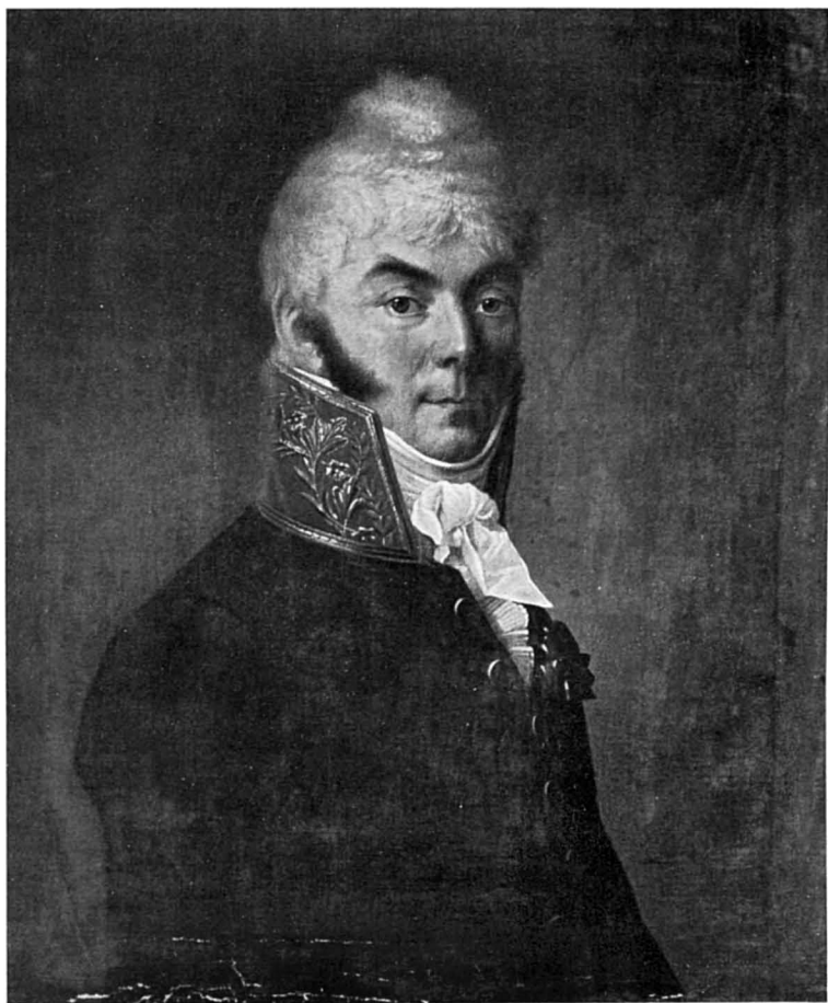
Николай Николаевич Новосильцовъ. (Съ портрета, находящагося въ Академіи Наукъ).